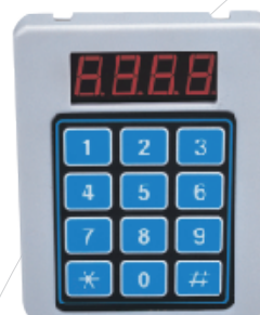
登録用設定機 SF-2000K (オプション)